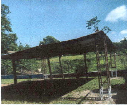
Foto1: Sustitución de lamina por lamina (troquelada) aluzinc calibre 26